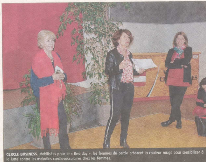
CERCLE BUSINESS. Mobilisées pour le « Red day », les femmes du cercle arborent la couleur rouge pour sensibiliser à la lutte contre les maladies cardiovasculaires chez les femmes.

C'était le cas mardi dernier, avec un temps de présentations