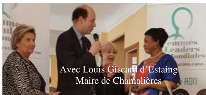
Avec Louis Giscard d'Estaing Maire de Chamalières