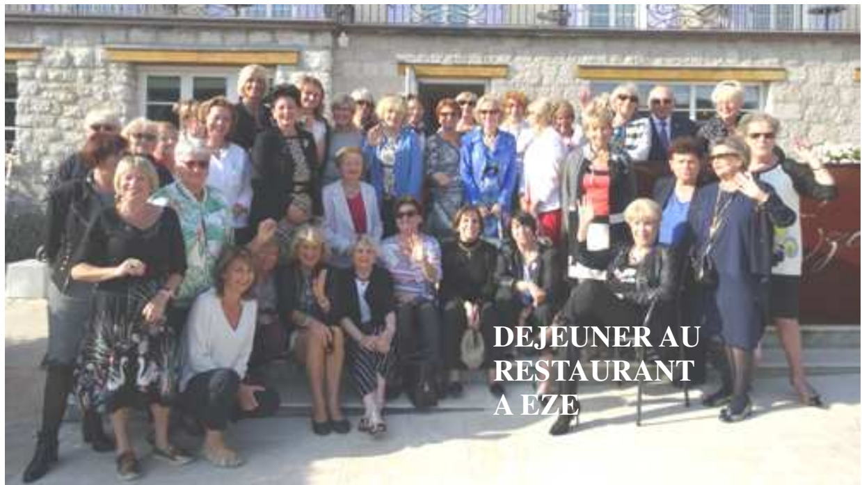
DEJEUNER AU RESTAURANT A EZE