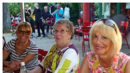
Belle soirée d'été la première ! Le « Gatec Jazz Band » animait