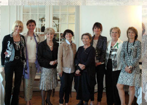
FEMMES ISSUES DU MONDE POLITIQUE. Trois femmes élues ont pu partager leurs expériences auprès des femmes leaders.

En effet, on nomme quelquefois des femmes qui n'ont comme intérêt politique « que de peu la connaître » et ainsi de ne pas être dangereuses pour les places à octroyer qui sont, en général, cooptées par les hommes entre eux, du fait de leurs réseaux depuis tant d'années.