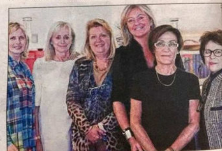
L'association des Femmes Leaders mondiales Monaco s'apprête à monter sur la scène du Théâtre des Variétés.

Lund 14 décembre, théâtre des Variétés, 1 bd Albert I er à Monaco. Tarifs : 25€, Pers. 06.08.21.98.32 et chantal@monaco.mc.