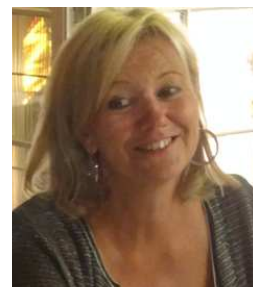
RAPPORT D'ACTIVITE INTERNATIONAL

De plus une demande d'inscription de la Chaîne des Puys au patrimoine mondial de l'UNESCO est en cours