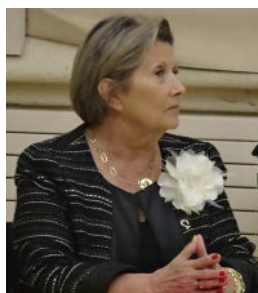
RAPPORT D'ACTIVITE GENERAL