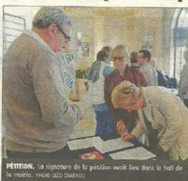
PÉTITION. La signature de la pétition avait lieu dans le hall de la mairie.

Toutes les signatures papiers recueillies, hier, par la municipalité de Vichy, tenaient sur une feuille. Les élus avaient pourtant prévu bien plus de papiers pour la pétition de l'appel du 19 septembre, lancée par l'Association des maires de France.