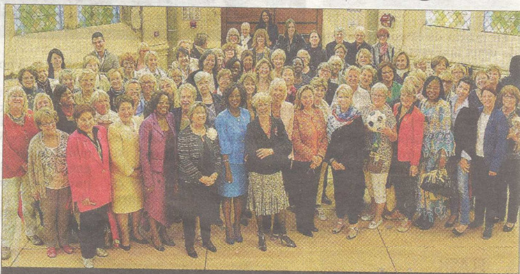
RELAIS. Les Femmes leaders mondiales se sont rassemblées pour mettre en perspective le travail qu'elles effectuent au niveau mondial.

L'occasion pour les femmes leaders de se rencontrer et de découvrir le département. Ainsi, hormis l'assemblée générale et le bilan de l'association, les femmes ont visité Clermont-Ferrand, le puy de Dôme puis se sont rendues à Vichy. Au cours de ce rassemblement, les adhérentes ont également