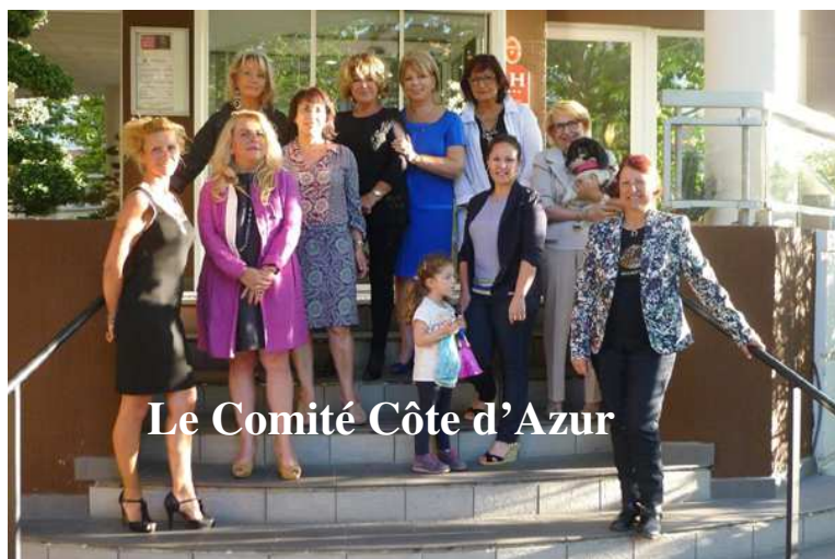
Le Comité Côte d'Azur