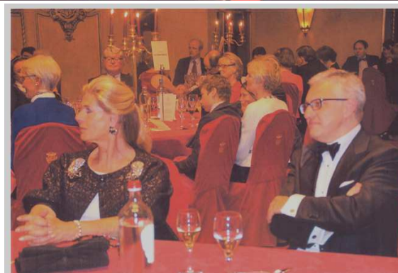
la Princesse Alexandra de Belgique