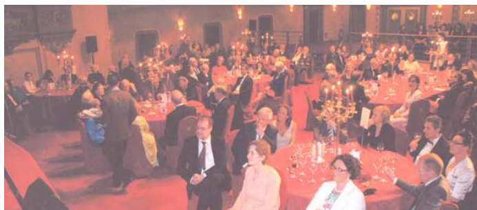
L' Assistance était très nombreuse à cette Soirée