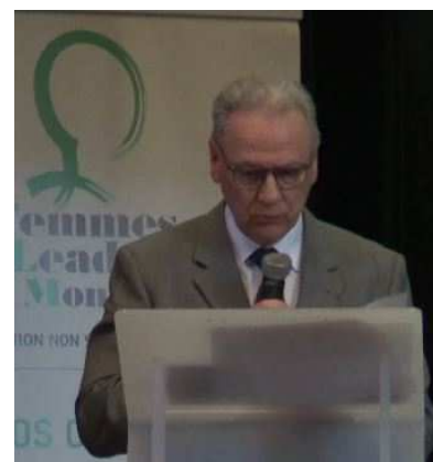
Clôture du Congrès par Monsieur le Préfet du Puy de Dôme Frédéric CHOPIN Qui félicite les Femmes Leaders Mondiales pour leurs actions