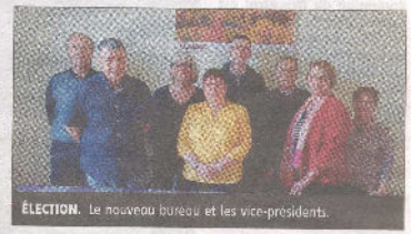
ÉLECTION. Le nouveau bureau et les vice-présidents.